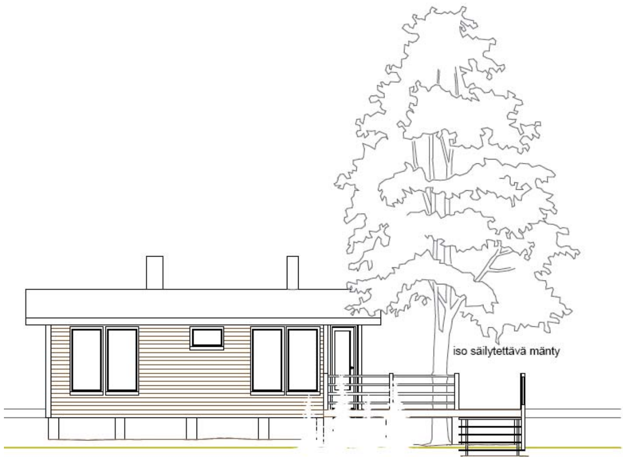
iso säilytettävä mänty